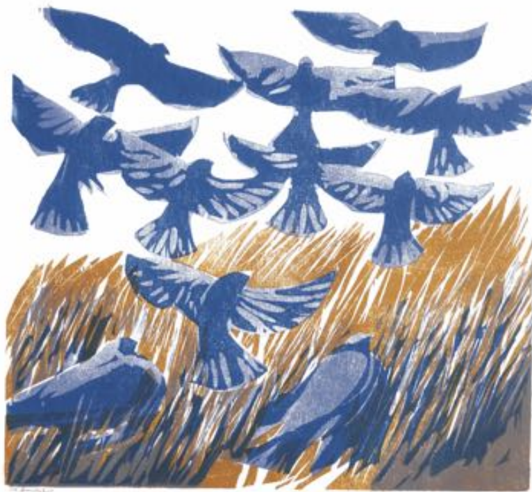
Auffliegende Vögel, Farbholzschnitt (1984)