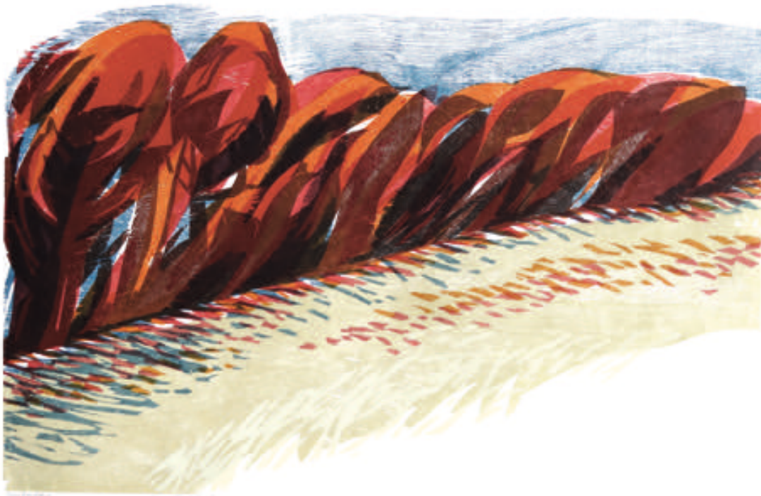
Herbstbaumgruppe, Farbholzschnitt (1981)