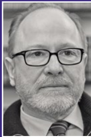
Jan Philipp Reemtsma